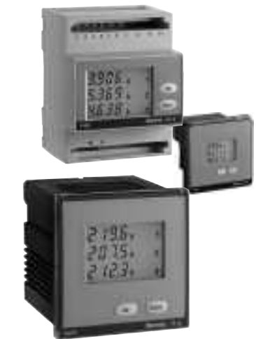
Cod. MF6G.. • MF7G.. • MF9G..

Die Anzeigeseiten und die Größen weichen abhängig von der Anschlussart (einphasig, dreiphasig 3 und 4 Leitungen) ab. PRÜFUNG DER PHASENFOLGE Beim Einschaltung des Gerätes wird geprüft, ob die Voltmeterphasen (Phasenfolge) richtig angeschlossen sind. Ob der Anschluss falsch ist, wird Err 123 YES angezeigt. In diesem Fall müssen Sie den Voltmeterphasenanschluss verbessern und die Prüfung wiederholen, bis Sie die richtige Folge erreichen. ACHTUNG! Eine falsche Phasenfolge kann Messfehler verursachen.